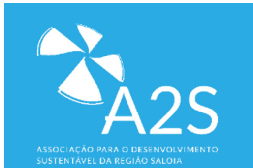
A2S ASSOCIAÇÃO PARA O DESENVOLVIMENTO SUSTENTÁVEL DA REGIÃO SALOIA