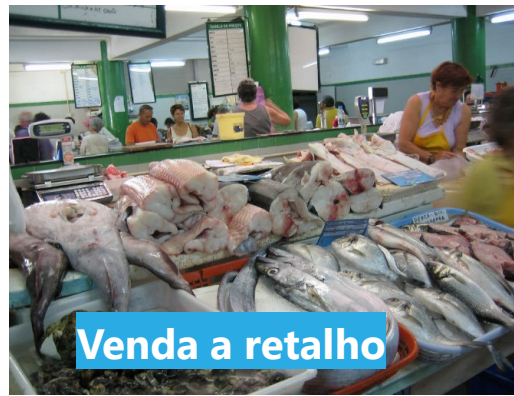
Venda a retalho