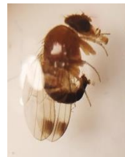
Figura 1. Macho D. suzukii

A D. suzukii é uma mosca do vinagre, mas contrariamente a outras espécies de moscas da mesma família ( Drosophilidae ), a D. suzukii é capaz de inserir os ovos em frutos saudáveis, não danificados e maduros (Cini et al., 2012). Esta sua preferência por frutos são e em amadurecimento, relaciona-se com o facto de as fêmeas terem um ovipositor serrilhado (Fig. 3), que lhes permite romper a cutícula e depositar os ovos nas fendas abertas. As fêmeas de D. suzukii colocam ovos em frutos em fase de maturação e as larvas desenvolvem-se no seu interior, alimentando-se da polpa e provocando a sua deterioração (Cini et al., 2012). No entanto, a simples inserção do ovipositor na epiderme do fruto pode causar danos, uma vez que facilita o acesso a infeções indiretas por agentes patogénicos, como fungos, leveduras e bactérias, que podem causar um rápido apodrecimento do fruto (Cini et al., 2012).