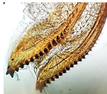
Figura 3. Ovipositor da fêmea D. suzukii