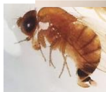
Figura 2. Fêmea D. suzukii