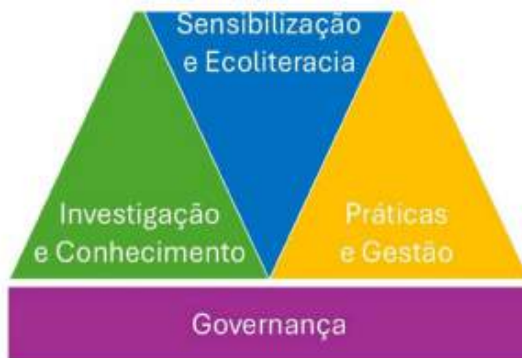
Figura 1 – Eixos estratégicos do Plano de Ação para a Conservação e Sustentabilidade dos Polinizadores.

O Plano de Ação para a Conservação e Sustentabilidade dos Polinizadores estrutura-se em três eixos temáticos (Eixos 1, 2 e 3) suportados por um eixo transversal de Governança ( Figura 1 ), que refletem os pilares consensualizados nos workshops participativos e nos grupos de trabalho do Plano de Ação. Cada eixo corresponde a um objetivo geral fundamental para responder aos desafios da conservação dos polinizadores em Portugal: