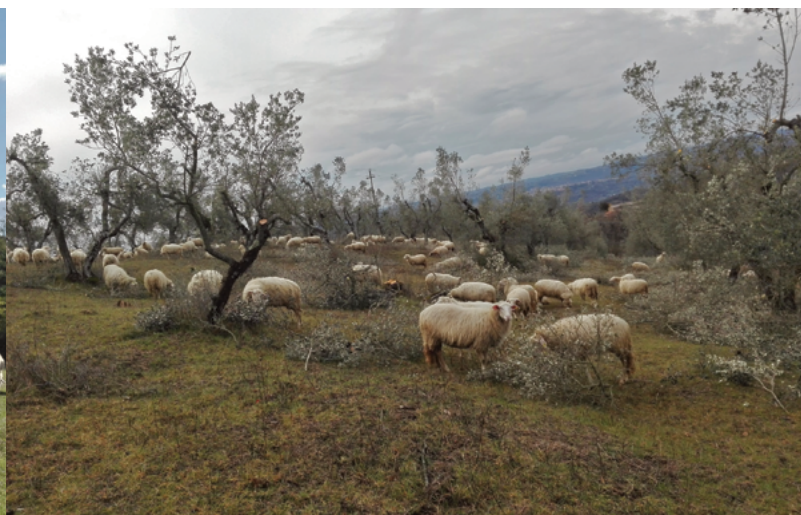
Gado ovino a alimentar-se dos resíduos resultantes da poda das oliveiras Claudia Consalvo