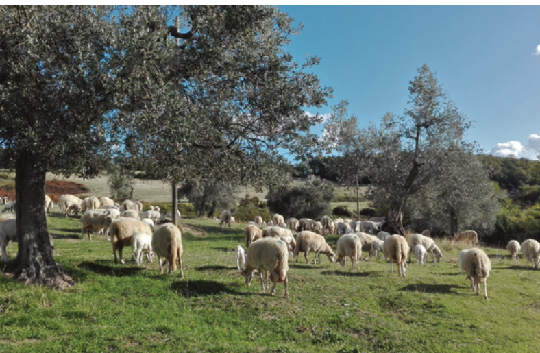
Gado ovino num olival tradicional em Orvieto, Itália. Claudia Consalvo

lactantes, a alimentação com folhas de oliveira resulta numa melhoria da qualidade da gordura do leite devido ao teor elevado de ácido linoleico. A alimentação do gado ovino com folhas de oliveira tem também um efeito positivo no perfil dos ácidos gordos do queijo, melhorando a qualidade da nutrição humana. O pastoreio em olival com gado ovino permite ainda reduzir os custos do controlo da vegetação espontânea e de rebentos-ladrões, aumentando a reciclagem do azoto do sistema.