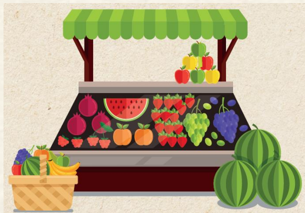
Venda na Exploração