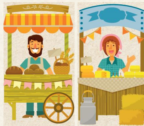
Mercado Local de Produtores